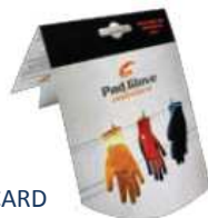
LARGE HANGER CARD